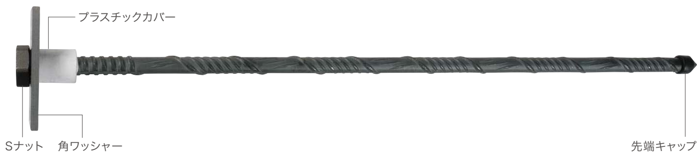
スーパースパイラルボルト SP24 諸元表