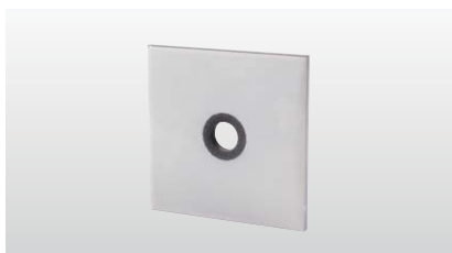
◆ シグナルワッシャー