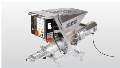
◆ MAIポンプ M400NT