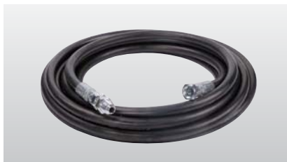
◆ デリバリーホース