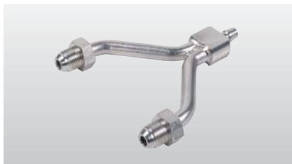
◆ ミキシングユニット