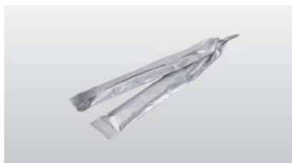
◆ コーキングカプセル