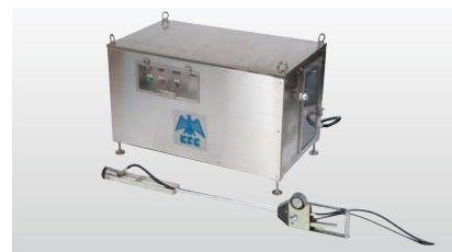
◆ 高耐力RPEポンプ+アーム