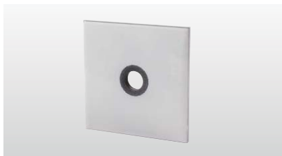
◆ シグナルワッシャー