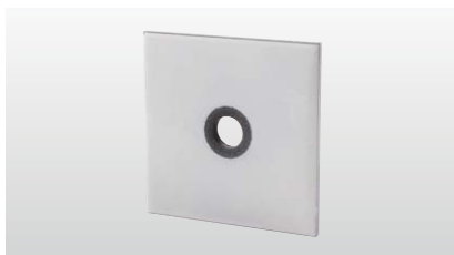
◆ シグナルワッシャー