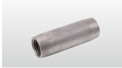
◆ ジョイントスリーブ