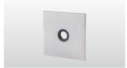
◆ シグナルワッシャー

※半球ワッシャーはベアリングプレートと組み合わせて使用します。 ※半球ワッシャー・ベアリングプレートは受注生産となります。