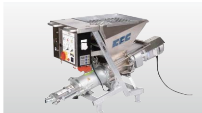
◆ MAIポンプ M400NT